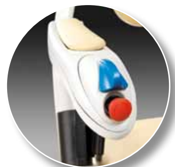
Comandi di bordo