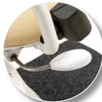
La manovra per la rotazione del sedile è comoda e veloce