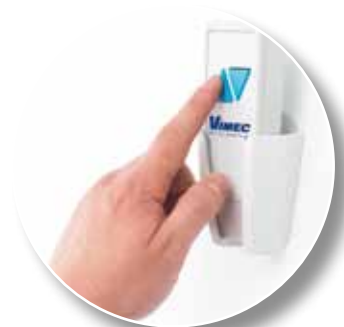
Telecomando di piano